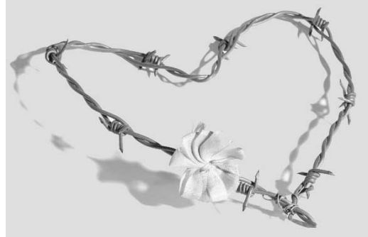
Werk von Annemarie von Matt

Damit Kinder schon früh die Schwellenangst vor dem Museum verlieren, starten wir ab Januar 2009 mit einem Kinderklub. Ziel dieses Kinderklubs ist es, die jüngsten Besucherinnen und Besucher für das Museum zu begeistern. Die Kinder sollen sich dabei längerfristig mit dem Museum und seinem Angebot identifizieren. Der Kinderklub ist für Kinder zwischen 8 und 11 Jahren zugänglich. Er trifft sich sieben Mal pro Jahr am Mittwoch Nachmittag und bietet zu unterschiedlichen Themen Workshops, Exkursionen und Ausstellungsbesuche an. Im 2009 beispielsweise können die Mit-