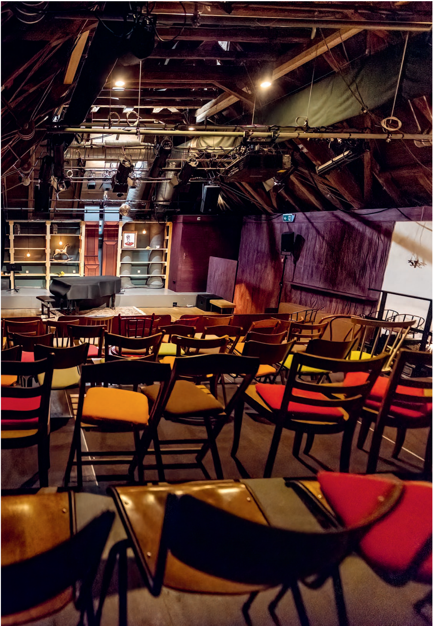
Der Bühnenraum im Chäslager.