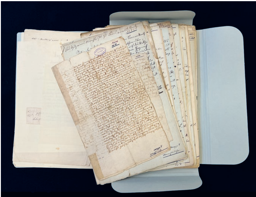
Marchbriefe aus dem Freiteilarchiv Sarnen.

Die Rechtsquellenstiftung plant, zahlreiche rechts-, sozial- und kulturgeschichtliche Quellen aus Obwalden zu recherchieren, aufzubereiten und zu publizieren. Das Projekt startet 2026 und dauert sechs Jahre.