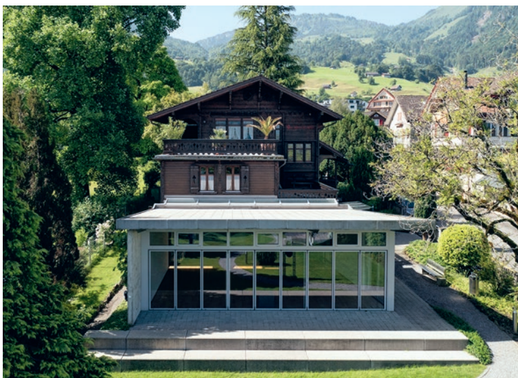
Ermitage mit Neubau.