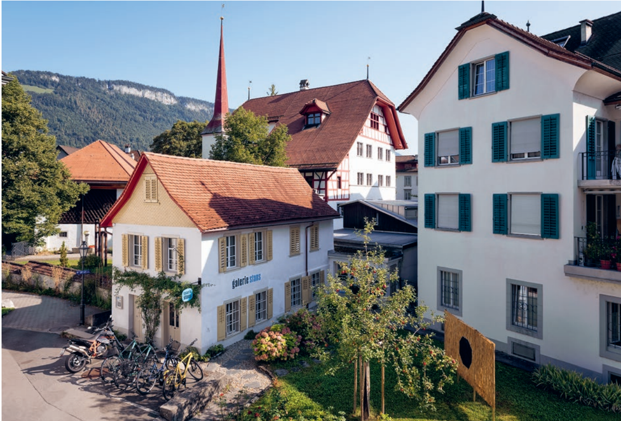
Höfli mit Chäslager, Galerie Stans, Restaurant Rosenberg und lit.z.

Kultur braucht Raum. Das hört man von Kulturschaffenden immer wieder. Doch welche Räume, welche Häuser haben die Kantone Nidwalden und Obwalden dafür zu bieten? Wir haben uns umgeschaut und entstanden ist eine recht ansehnliche Sammlung – ohne Anspruch auf Vollständigkeit.