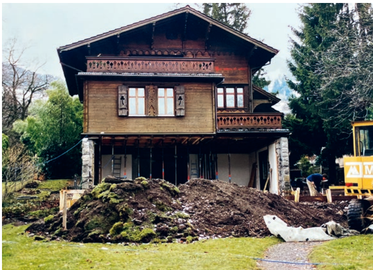
Ermitage in Beckenried im Umbau, 1999.

Wer durch Beckenried am Vierwaldstättersee schlendert, wird unweigerlich auf ein ganz besonderes Haus stossen: die Ermitage. Ein Ort, an dem Kunst, Literatur und Kultur seit mehr als einem Jahrhundert lebendig sind. Doch wie wurde aus diesem Wohnhaus ein pulsierendes Kulturzentrum? Die Antwort führt zurück zu einer aussergewöhnlichen Frau: zur Schriftstellerin Isabelle Kaiser.