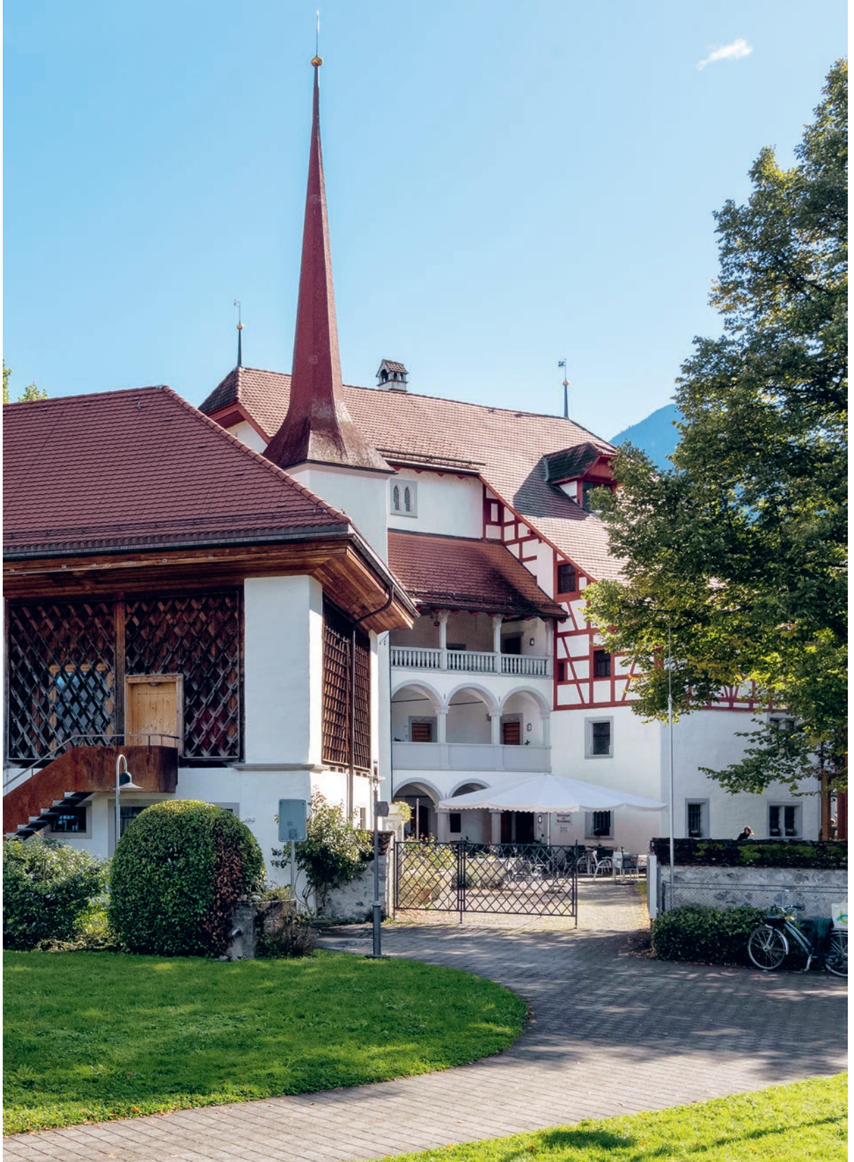
Das Höfli in Stans.

Hiiser fir d'Kultuir Von Häusern und Menschen