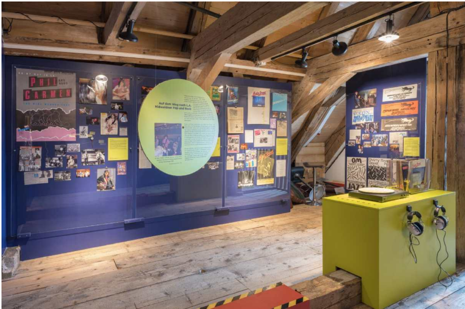
Ausstellungsansicht der Ausstellung «No Time To Lose. Von Stubeten, Dancings und Discos». BILDDOWNLOAD