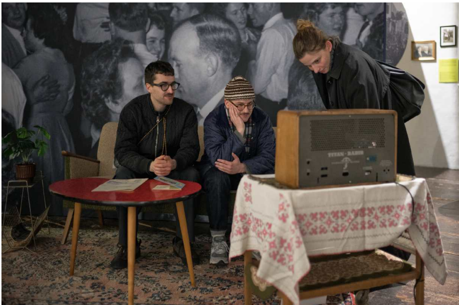
Besuchende reisen in die musikalische Vergangenheit der Schweiz. BILDDOWNLOAD