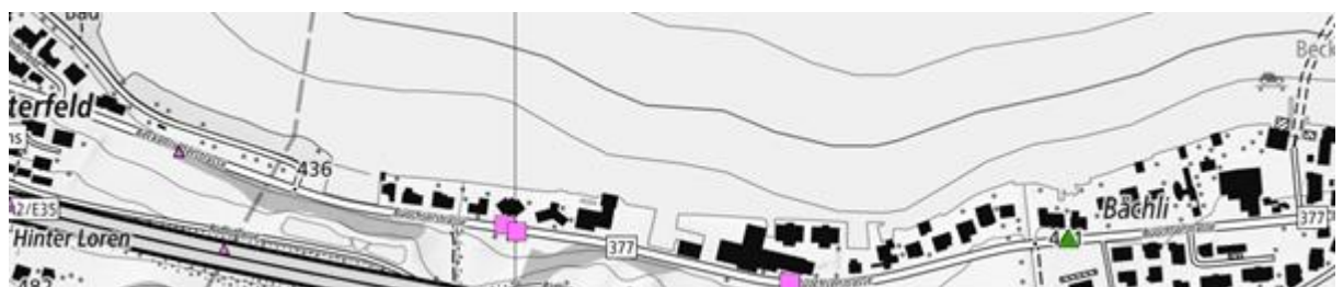
Abbildung 4 Unfallstatistik 2023

In der Unfallstatistik des ASTRA werden für den Zeitraum vom 2017 – 2019 im Perimeterbereich drei Verkehrsunfälle mit Schwerverletzten (■ Schleuder- oder Selbstunfall) aufgeführt, davon deren zwei mit einem Fahrrad. 2018 wurde ein Auffahrunfall (▲) mit Leichtverletzten und Fahrrad erfasst.