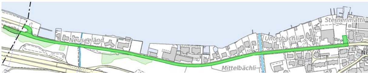
Abbildung 1 betroffener Projektabschnitt

Die im Radwegkonzept 2008 zwischen der Einmündung Seestrasse/Buochserstrasse und Abzweigung Fähreanlegestelle Beckenried bezeichnete Strasse ist Teil der Kantonsstrasse KH3.