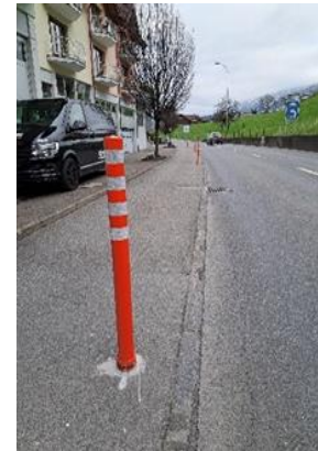
Abbildung 2 Strassenbreite und getroffene Sofortmassnahmen

Ein Kreuzen von Bus-LKW in dem von den Postulanten beschriebenen Abschnitt ist nicht möglich und führt zu wiederholtem Ausweichen auf das Trottoir. Aus diesem Grund mussten mit Aufstellen von Pollern kurzfristige Massnahmen ergriffen werden.